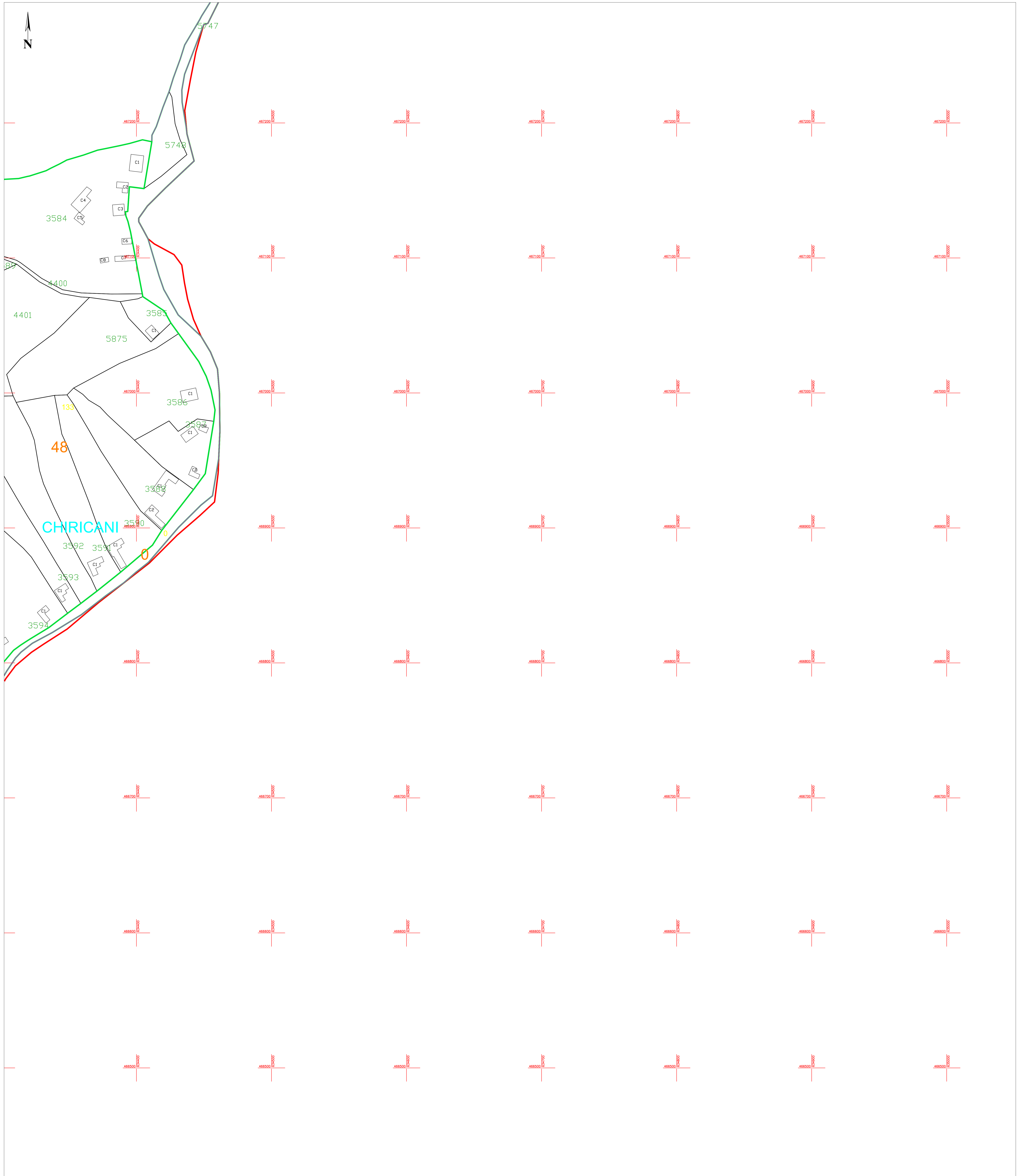
Schiță cu dispunerea sectoarelor cadastrale