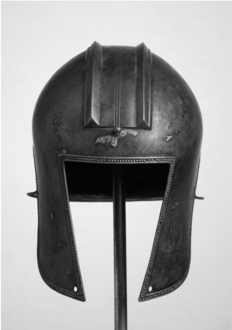
Muzeul Național al Banatului (MNaB), în parteneriat cu TactileLibrary® Research Center din cadrul Universității de Vest din Timișoara și cu sprijinul Continental Anvelope România, lansează proiectul „Tactil”, o inițiativă inovatoare care își propune să transforme modul