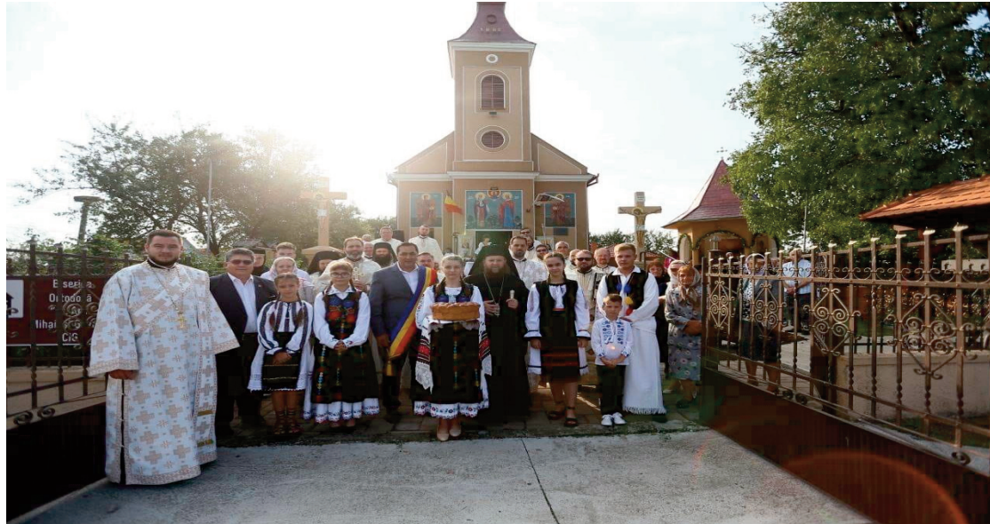
Răspunsurile liturgice au fost oferite de Corala „Solemnis” a Parohiei Ortodoxe

Răspunsurile liturgice au fost oferite de Corala „Solemnis” a Parohiei Ortodoxe „Nașterea Domnului” din Municipiul Satu Mare, dirijată de