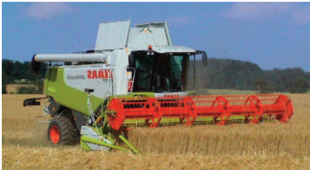
În acest an, la prețul de 65 – 75 de bani kilogramul de grâu panificabil, nu sunt mari șansa ca la o producție sub 7.000 de kilograme la hectar, să poți recupera cheltuielile

Spre exemplu, la Agenția de Plăți și Intervenție pentru Agricultură – APIA, nu sunt evidențiate suprafețele mai mici de 3.000 de metri pătrați, așa cum aceste suprafețe mici nu apar nici în evidențele DAJ, doar unele fiind raportate la primării. Micii fermieri sunt mai ignoranți în ceea ce privește relațiile cu unele autorități. Oamenii își văd de treabă, convinși fiind că ceea ce obțin ca producții, acoperă necesarul de consum al gospodăriei, eventual mici disponibilități în ceea ce privește vânzarea pe piața liberă.