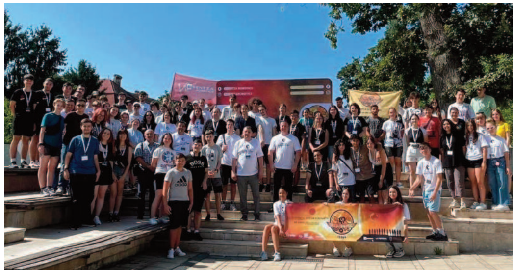
Programul taberei a fost unul intens, cuprinzând cursuri FTC, dezbateri, activități de team building, provocări, vizite tematice și divertisment