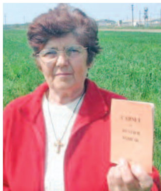
Sunt mai mulți pași de parcurs și în online

După cum menționează publicația Agroinfo, pentru obținerea sumei de bani reprezentând renta viageră agricolă aferentă anului 2022, rentierii vor solicita viza anuală,