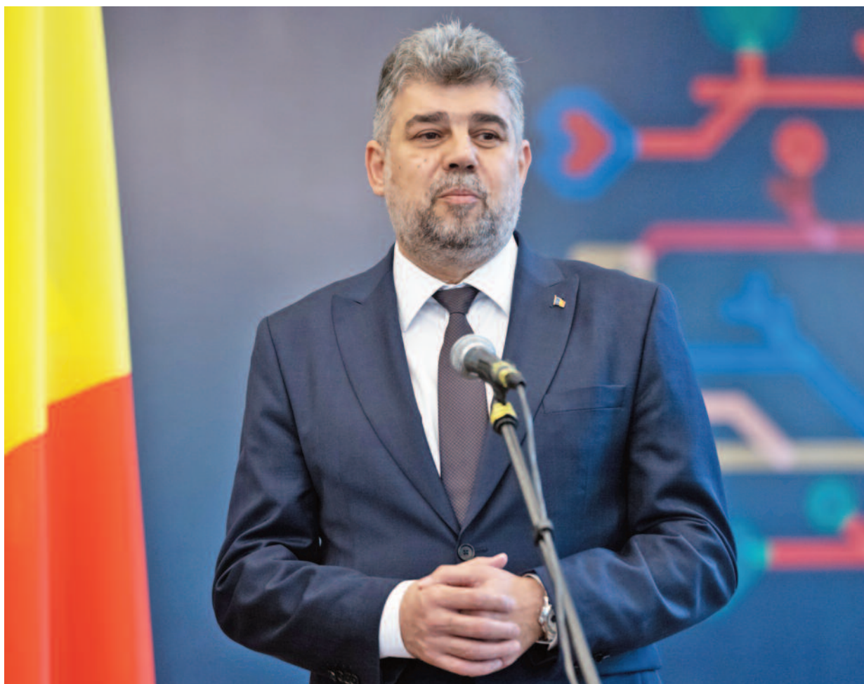
Marti după amiază, premierul Marcel Ciolacu a avut o discuție de câteva ore la Palatul Victoria cu președintele Senatului, Nicolae Ciucă