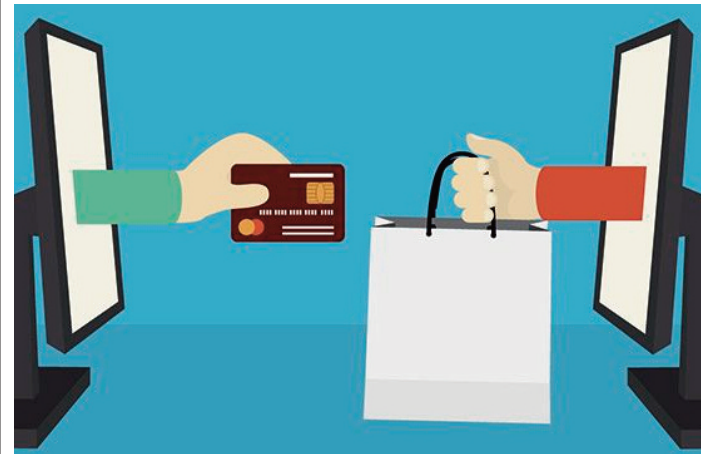
Produsele alimentare vândute de magazinele online au cunoscut scăderi semnificative de preț în ultimele luni

Prețurile din mediul online produsele preferate. Având acces rapid la diferite site-uri și