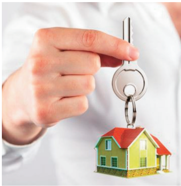
Față de aceeași perioadă a anului trecut, chiriile medii sunt mai ridicate, cea mai semnificativă creștere regăsindu-se la garsoniere

Lunile august și septembrie sunt cele în care se pregătesc revenirea elevilor, dar mai ales a studenților la cursuri. Viitorii studenți sunt în căutare de o chirie, cât mai aproape de campusul universitar unde vor învăța, dar proprietarii au tendința de a crește prețurile cu cât se apropie data de începere