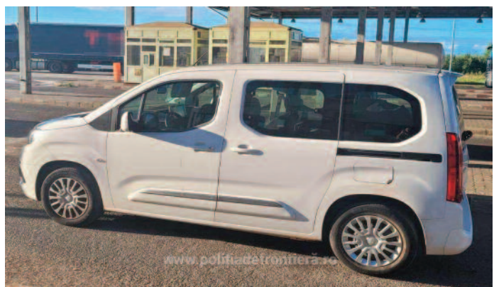
Mașină de 98.900, furată în Spania, descoperită la Petea

Polițiștii frontieră anunță încă o mașină furată depistată la vamă. Încă se mai cumpără mașini furate din străinătate, de data aceasta din Spania.