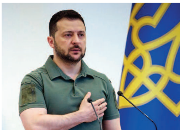
Ucraina crește producția autohtonă de armament, anunță Zelenski

Pe de altă parte, președintele Dumei de Stat de la Moscova, Viaceslav Volodin spune că președintele ucrainean Volodimir Zelenski va avea soarta fostului președinte georgian Mihail Saakașvili, aflat în detenție.