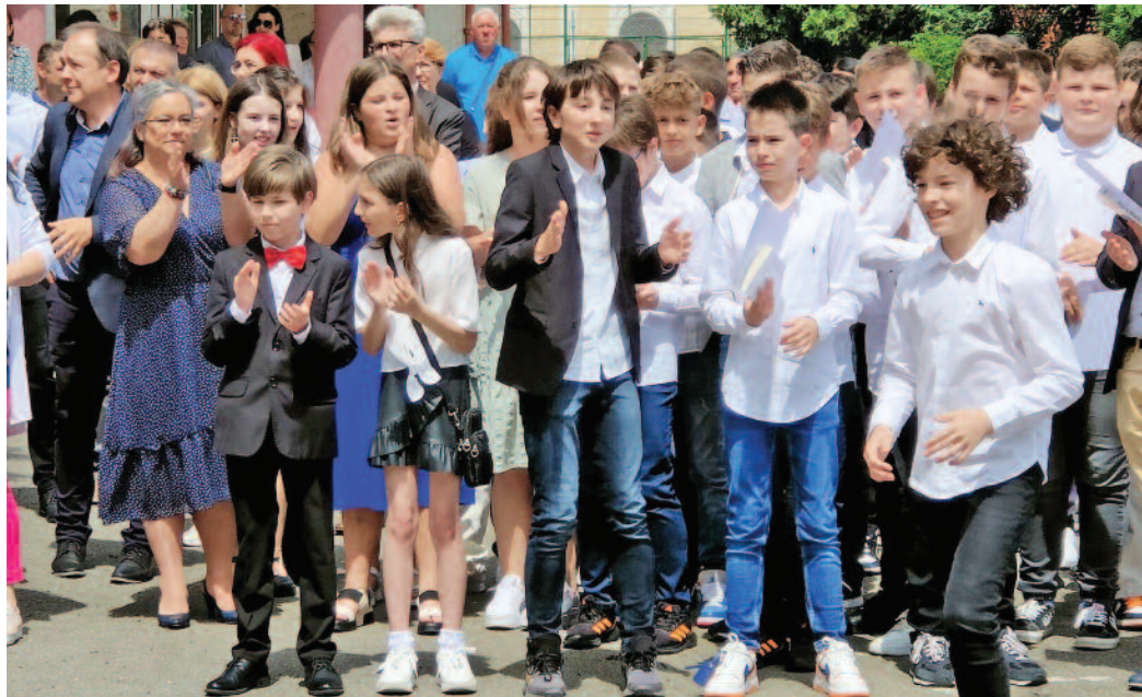
Festivitate pentru clasele V-VII și IX-XI la Colegiul Național "Mihai Eminescu"