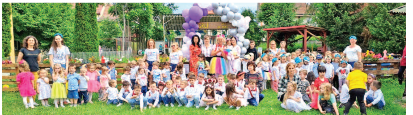
După o zi încărcată de o mulțime de evenimente, preșcolarii, dar și educatoarele sunt pregătiți pentru o binemeritată vacanță

Sfârșitul anului școlar aduce multă bucurie, dar și emoție.