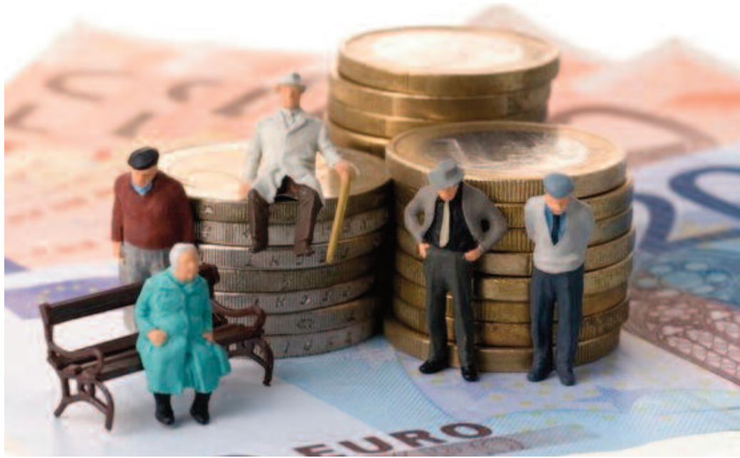
Comparativ cu trimestrul I al anului precedent, numărul mediu de pensionari a scăzut cu 41.000 persoane

Numărul mediu de pensionari de asigurări sociale de stat a fost de 4.599.000 persoane, în scădere cu 5.000 de persoane