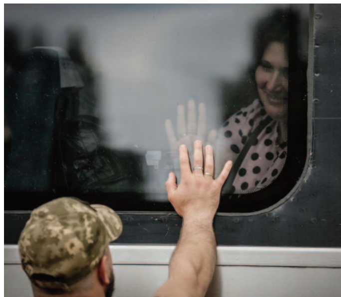
Nou atac masiv asupra orașelor Ucrainei

Patru avioane strategice rusești Tu-95MS au efectuat patru lansări de rachete de croazieră Kh-101/Kh-555 din Marea Caspică. Una dintre rachete a fost distrusă, restul a lovit instalații industriale din