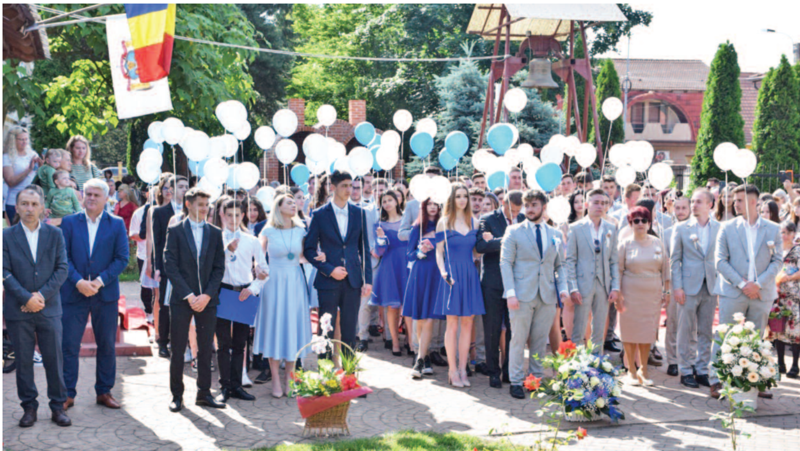
Festivitate pentru elevii din clasele terminale la Liceul Ortodox "Nicolae Steinhardt"

Oficial, azi clopoțelul sună pentru ultima dată în anul școlar 2022 - 2023