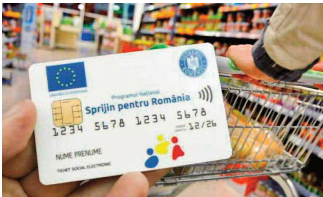
Până la finalul acestui an vor mai fi acordate alte trei tranșe de câte 250 lei

Faptul că această măsură și altele similare - vouchere educaționale, sprijin pentru mame, pachete alimentare pentru persoanele dezavantajate - sunt incluse în Programul Incluziune și Demnitate Socială și vor fi finanțate în perioada de