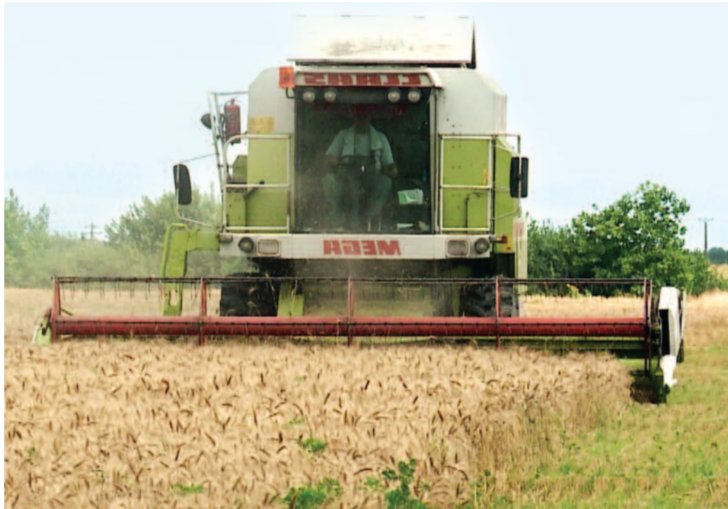
Producția de grâu din acest an va fi rentabilă doar de la 7 tone la hectar

Revenind la secetă și la efectele acesteia asupra producțiilor agricole obținute de