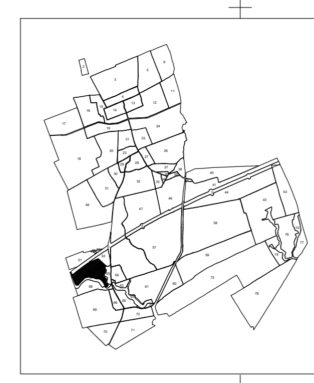
SCHEMA DE DISPUNERE A SECTOARELOR CADASTRALE