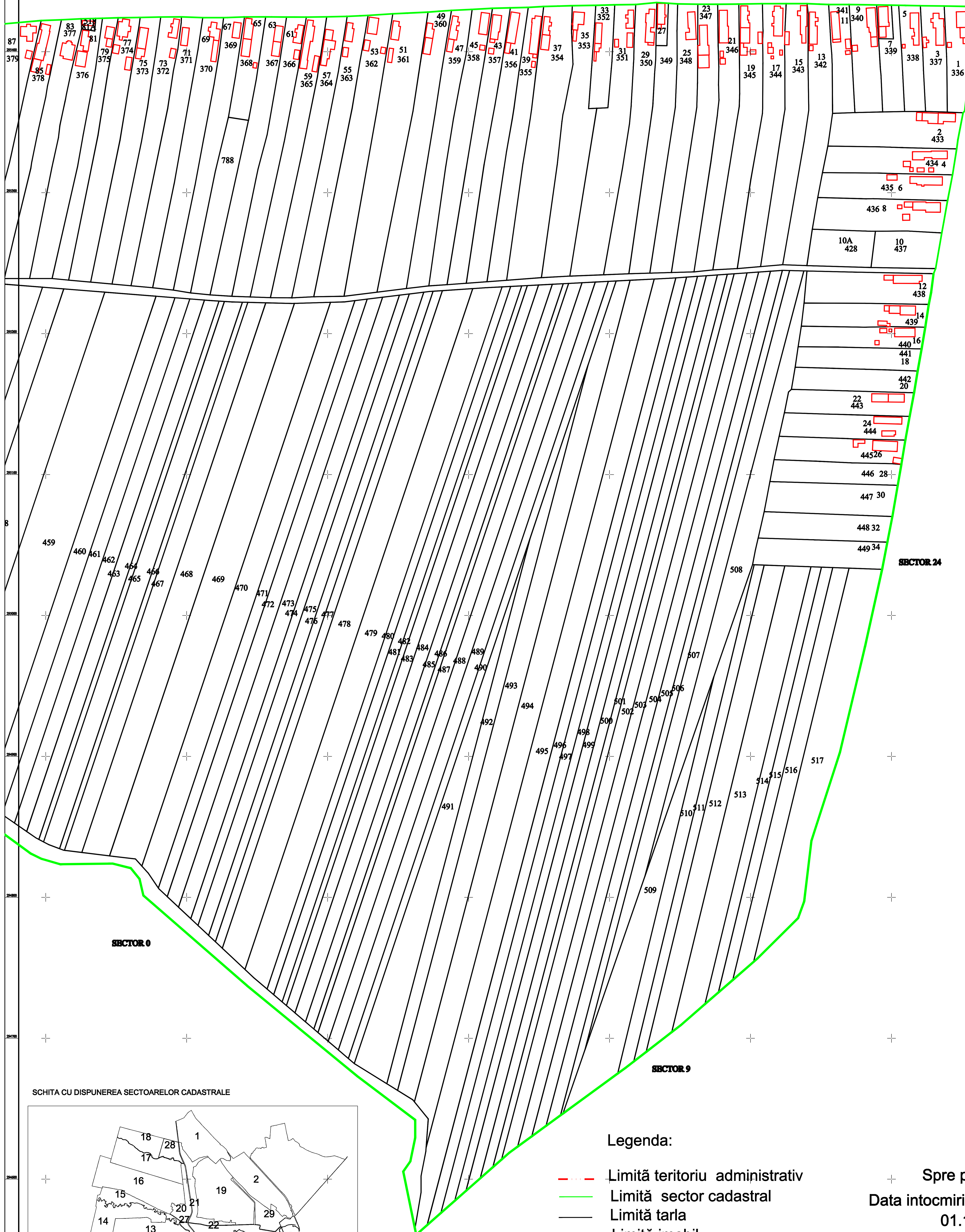
SCHITA CU DISPUNEREA SECTOARELOR CADASTRALE