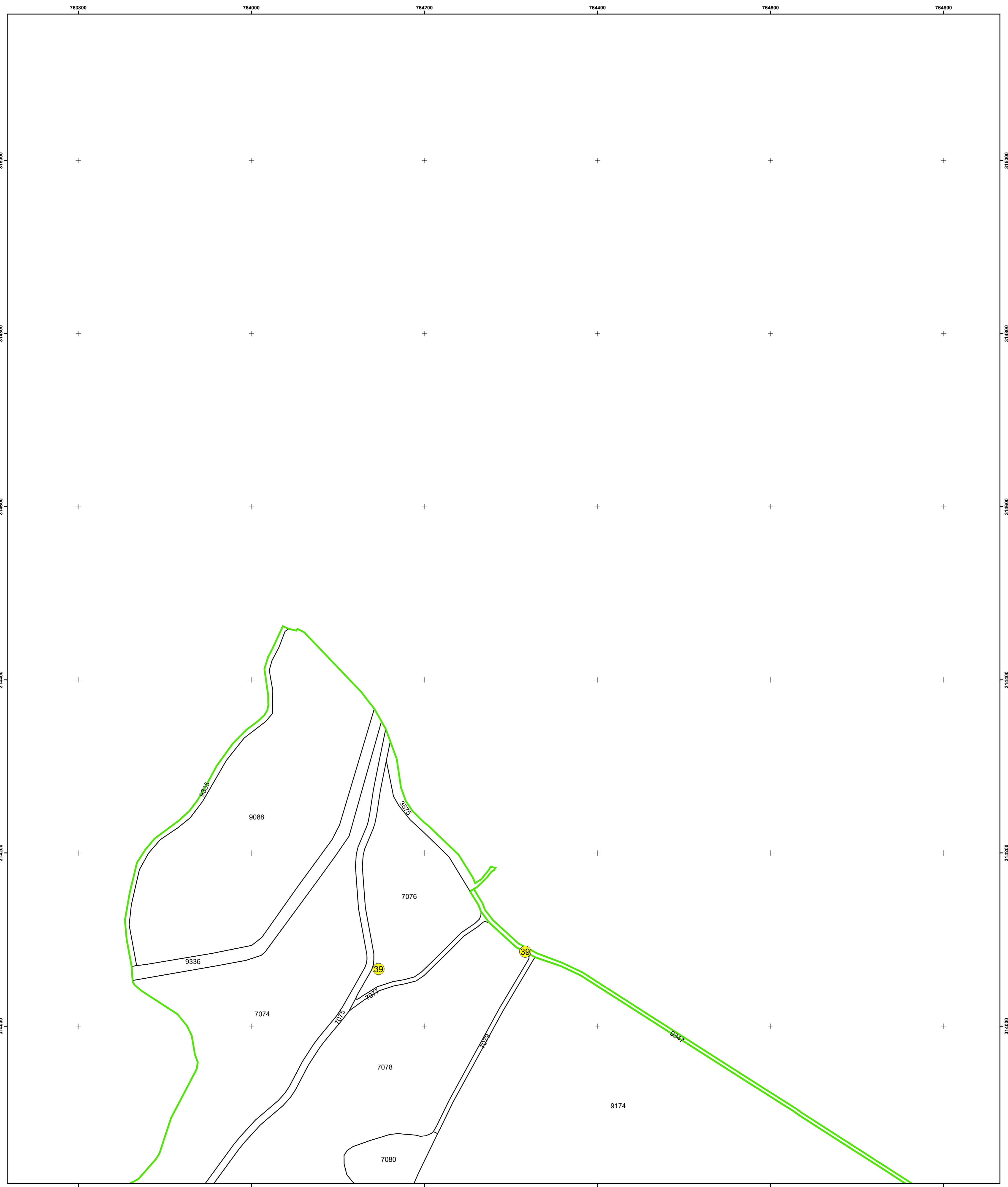
SCHIȚA DISPUNERII PLANȘELOR