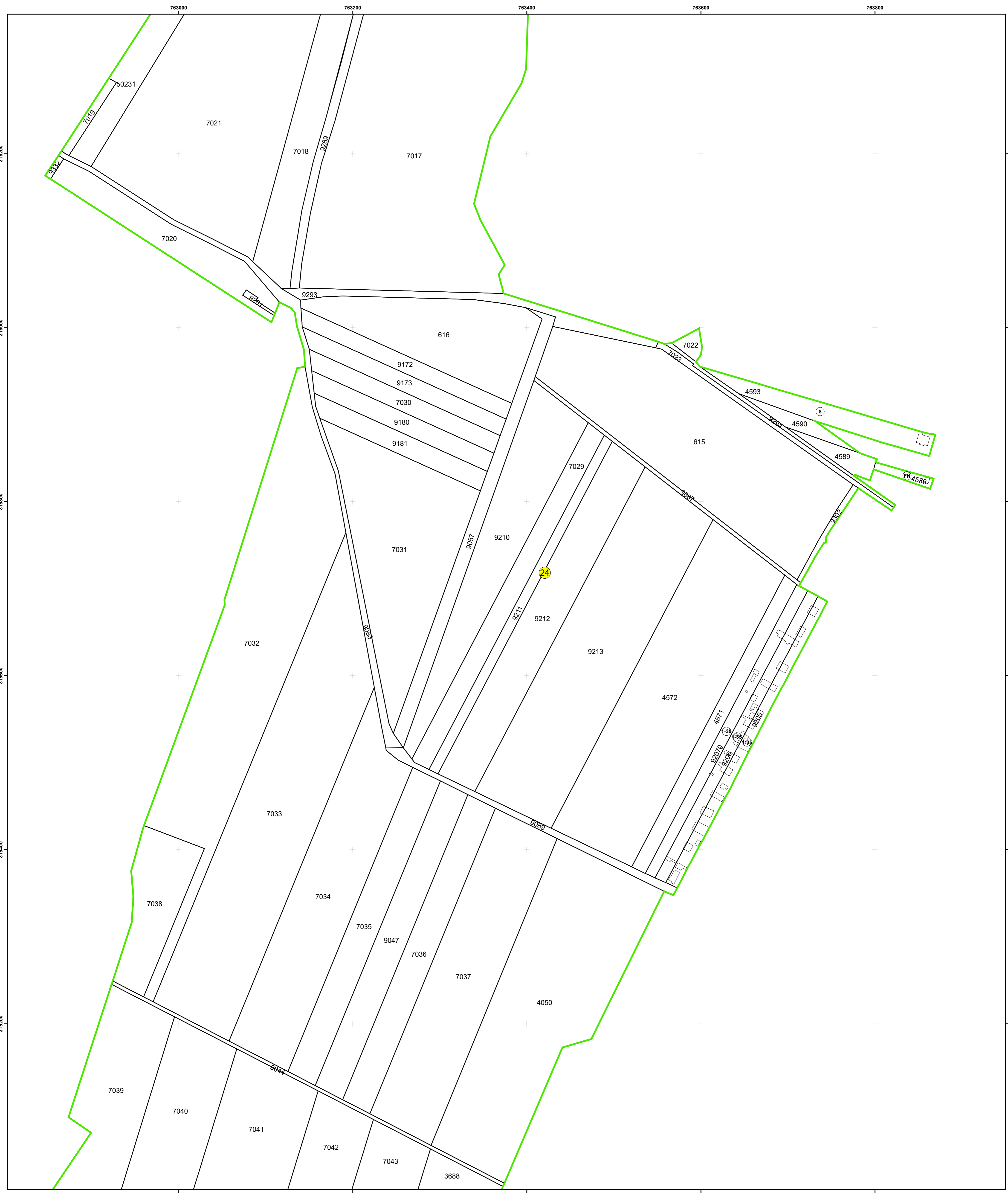
SCHIȚA DISPUNERII PLANȘELOR