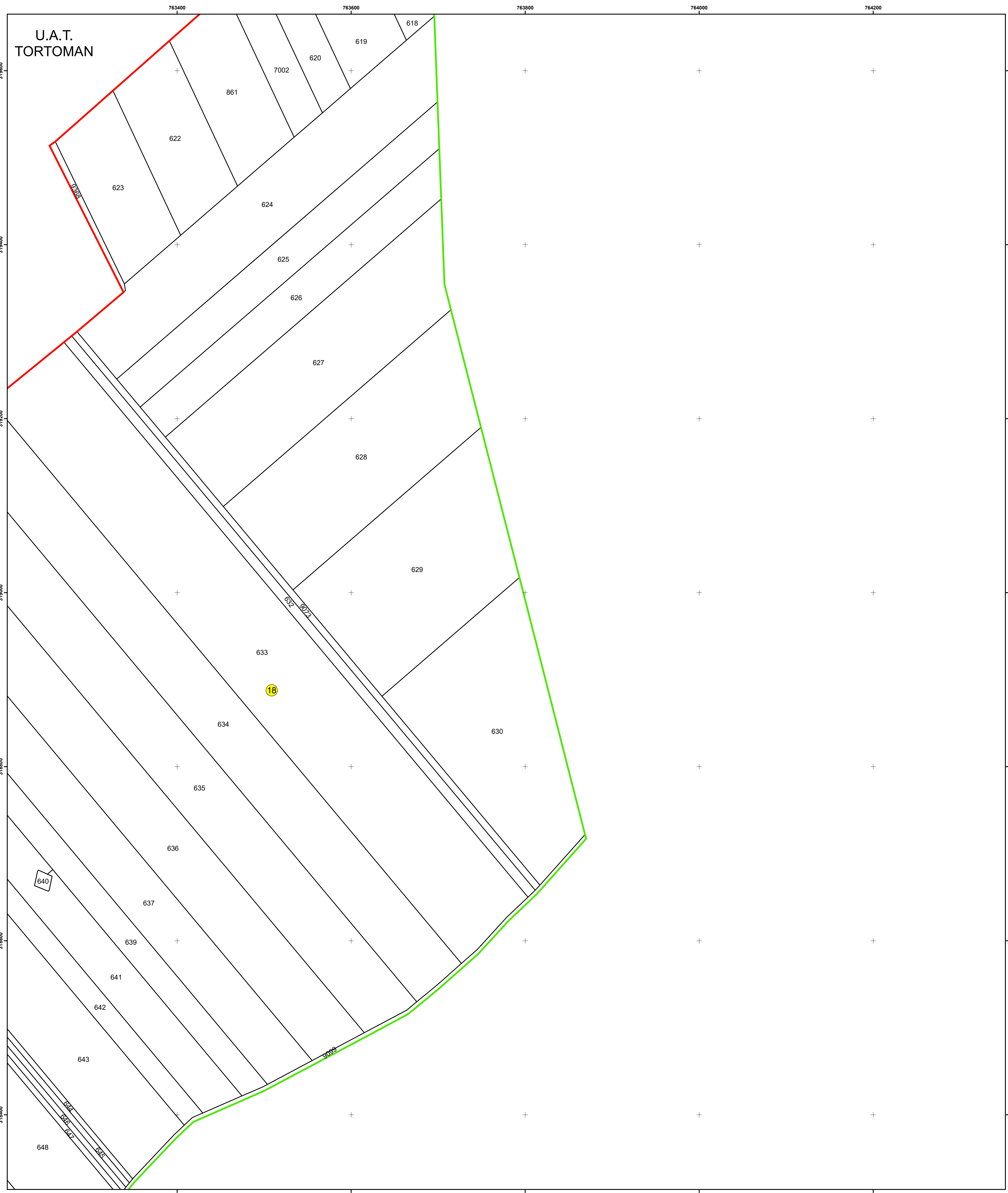
SCHIȚA DISPUNERII PLANȘELOR