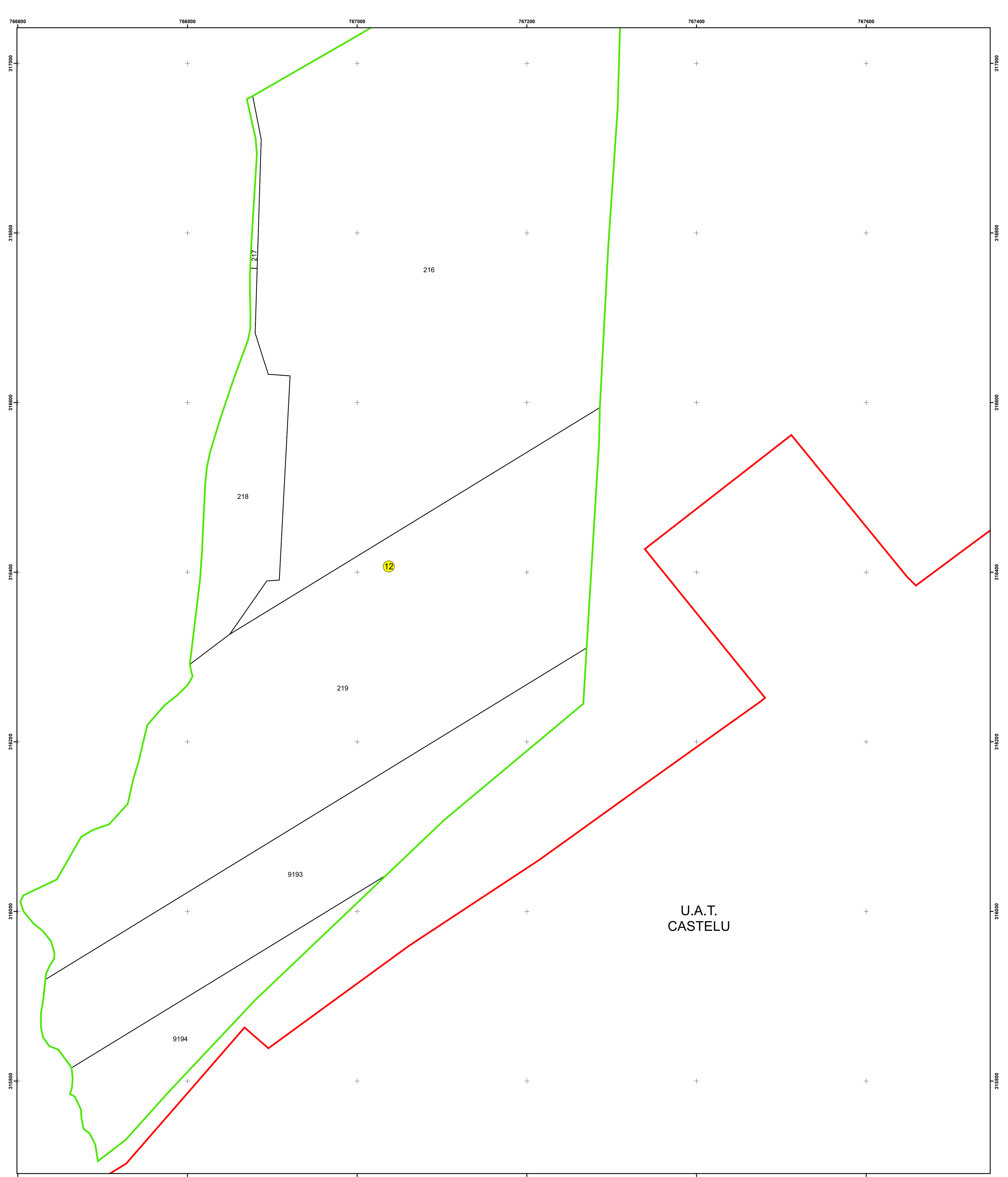
SCHIȚA DISPUNERII PLANȘELOR