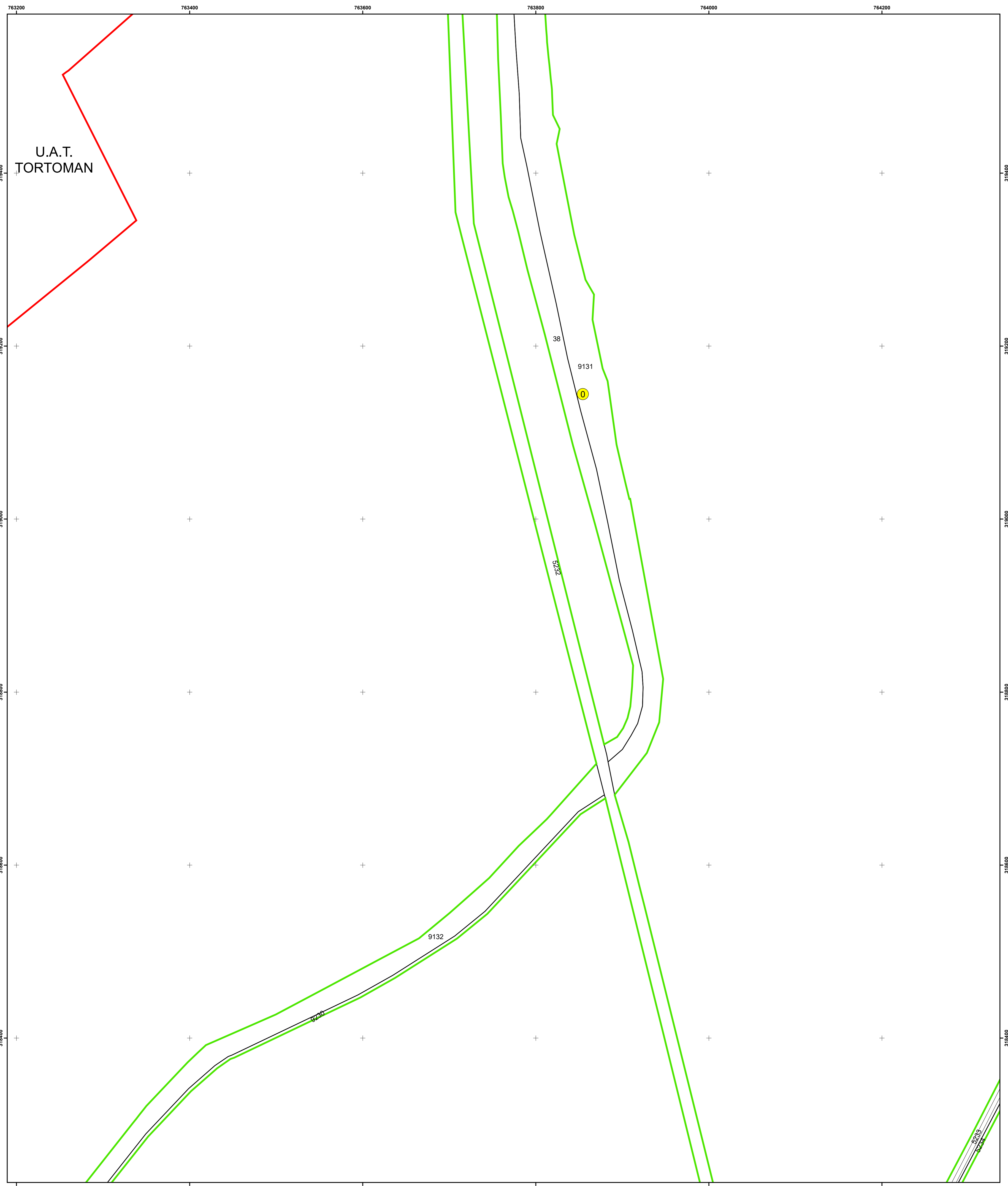
SCHIȚA DISPUNERII PLANȘELOR