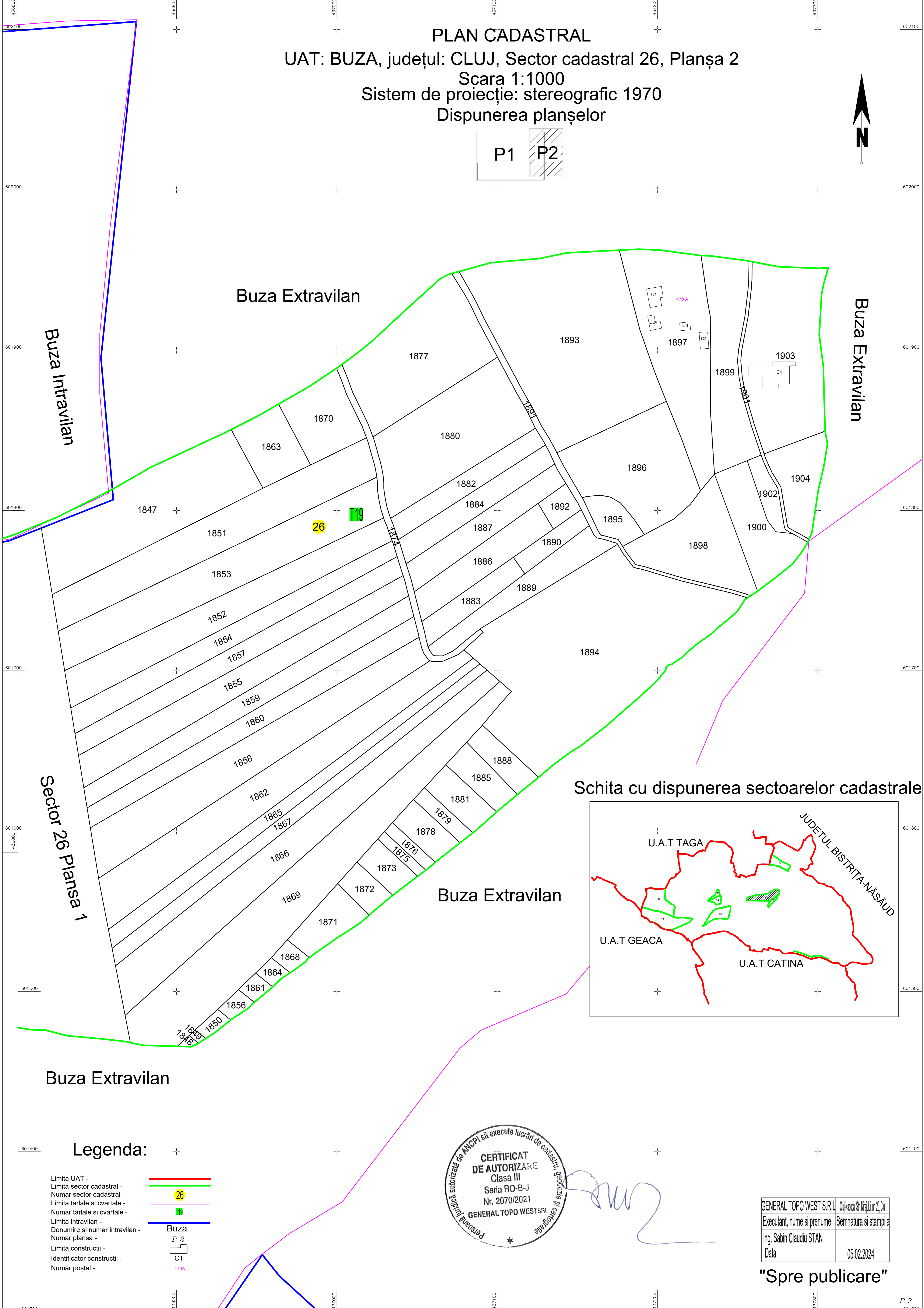
Schita cu dispunerea sectoarelor cadastrale