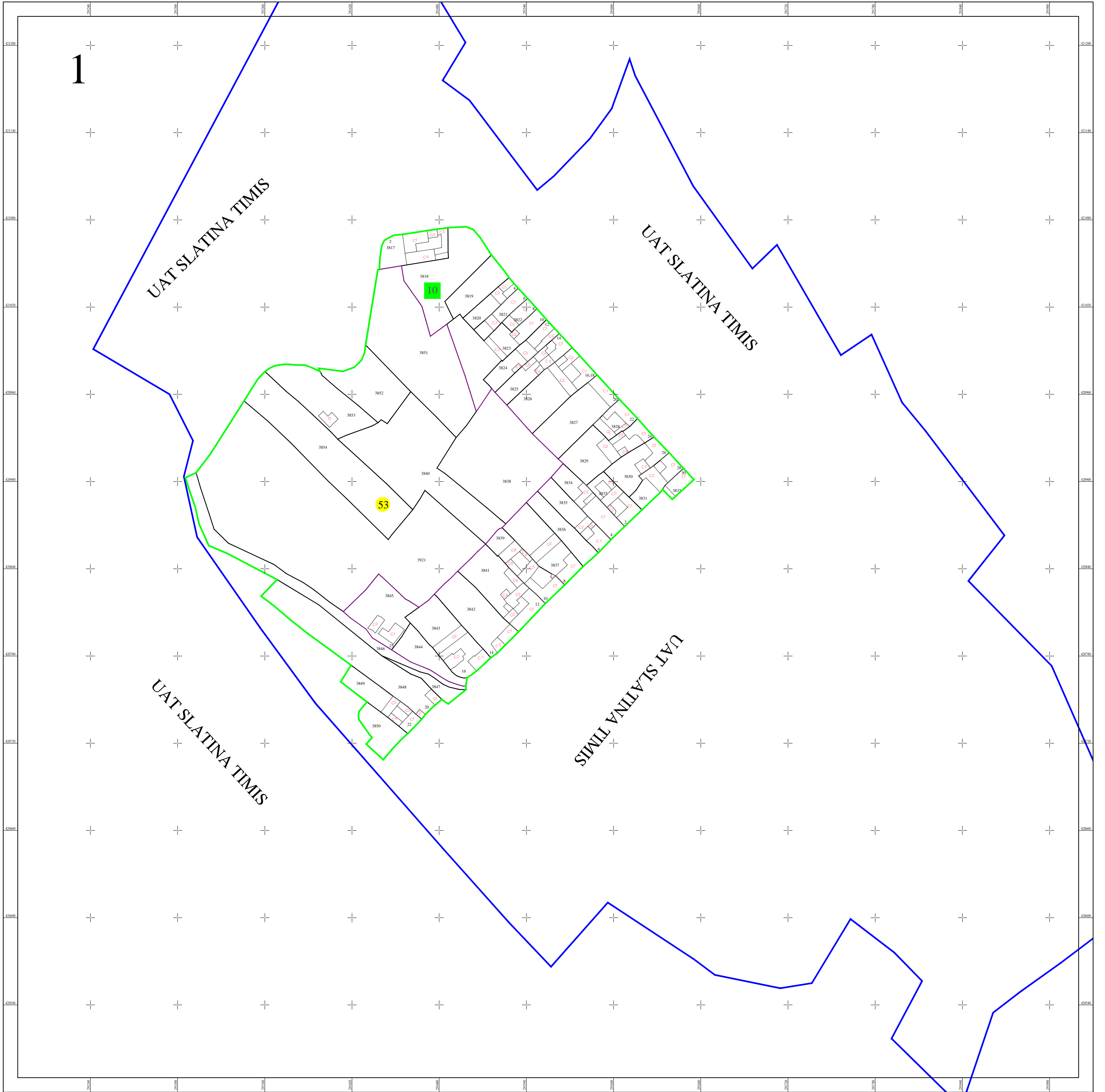
Schita dispunerii planselor