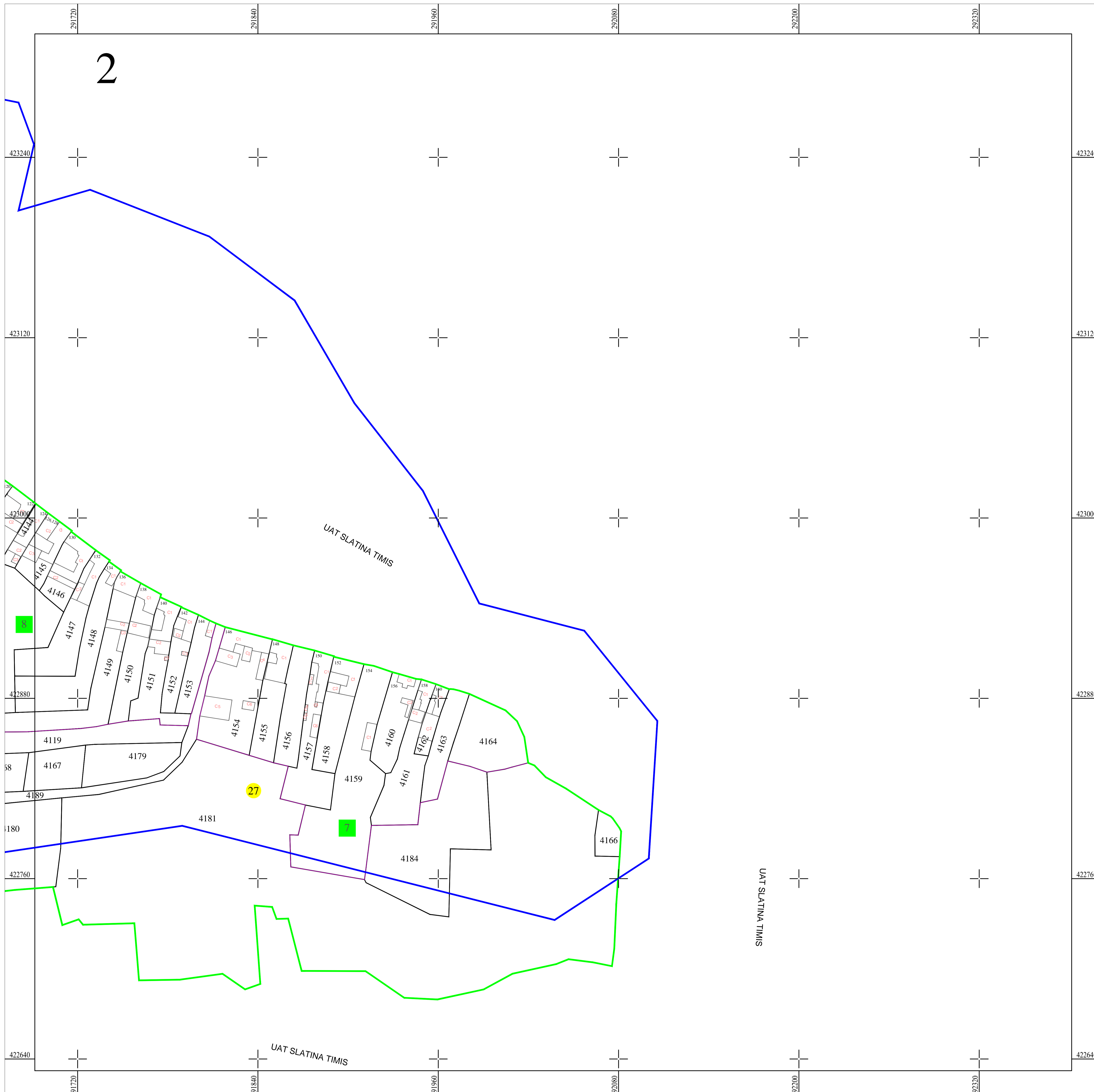
Schita dispunerii planselor