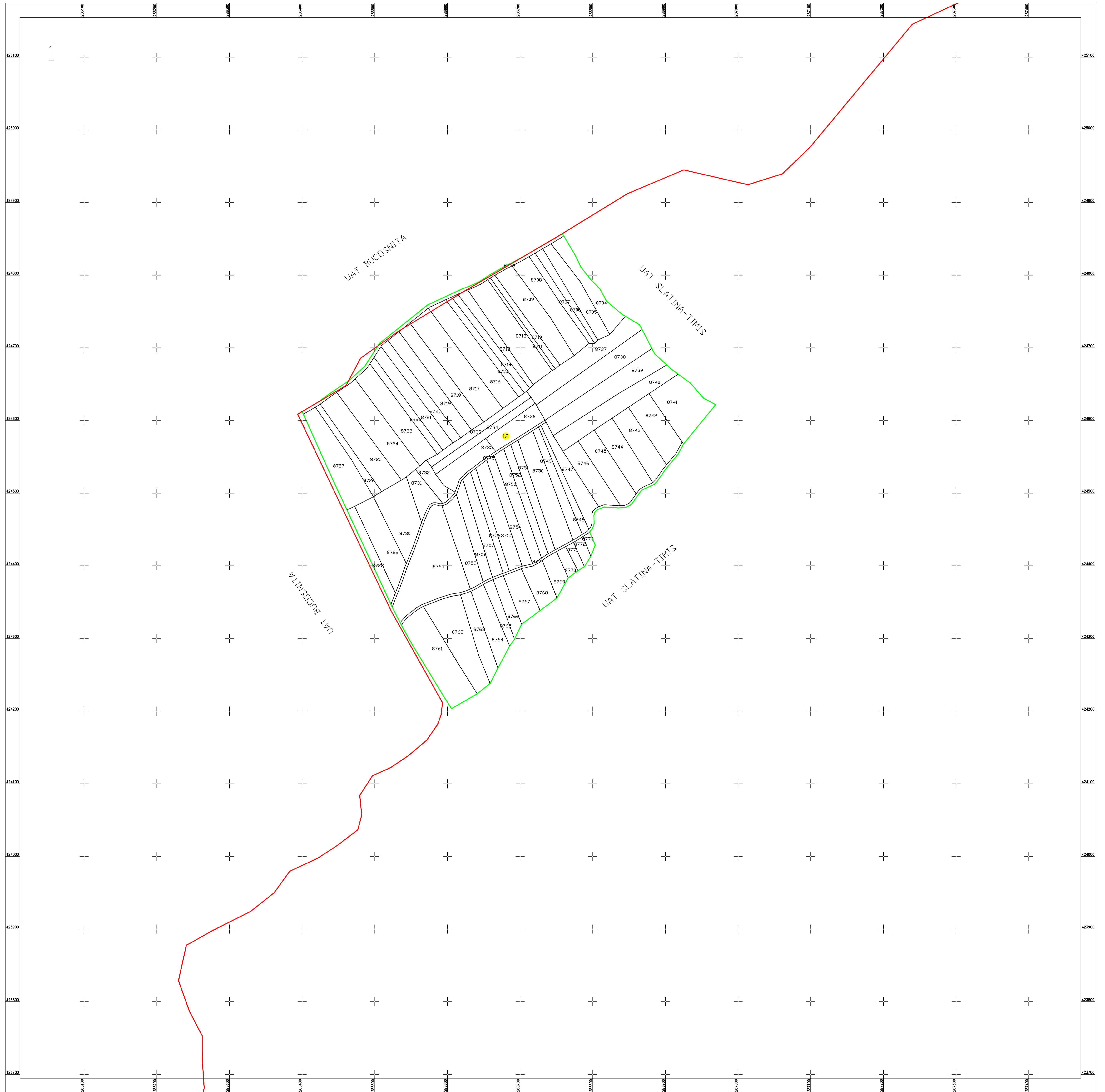
Schita dispunerii planselor