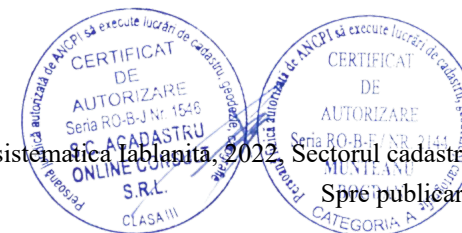
Pg. 1, înregistrare sistematică Iablanita, 2022, Sectorul cadastral nr. 127