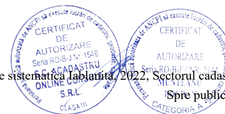
Pg. 7, înregistrare sistematică Iablanita, 2022, Sectorul cadastral nr. 101