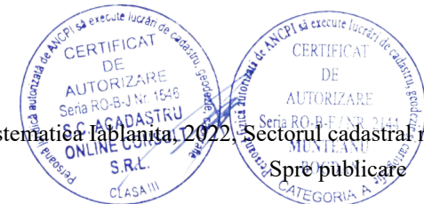
Pg. 2, înregistrare sistematică Iablanita 2022, Sectorul cadastral nr. 142