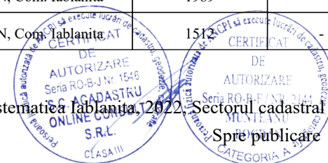
Pg. 1, înregistrare sistematică Iablanita, 2022, Sectorul cadastral nr. 103