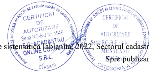
Pg. 5, înregistrare sistematică Iablanita, 2022, Sectorul cadastral nr. 103