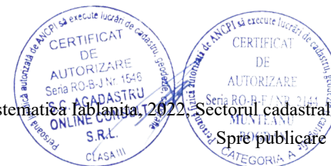
Pg. 1, înregistrare sistematică Iablanita, 12.02.2022, Sectorul cadastral nr. 129