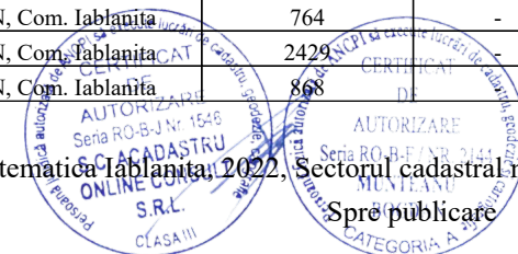
Pg. 1, înregistrare sistematică Iablanita, 2022, Sectorul cadastral nr. 142