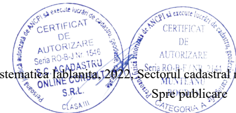
Pg. 1, înregistrare sistematică Iablanita, 12.02.2022, Sectorul cadastral nr. 149