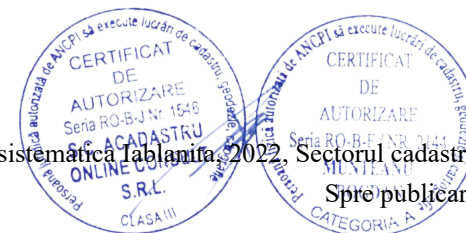
Pg. 1, înregistrare sistematică Iablanita 2022, Sectorul cadastral nr. 102