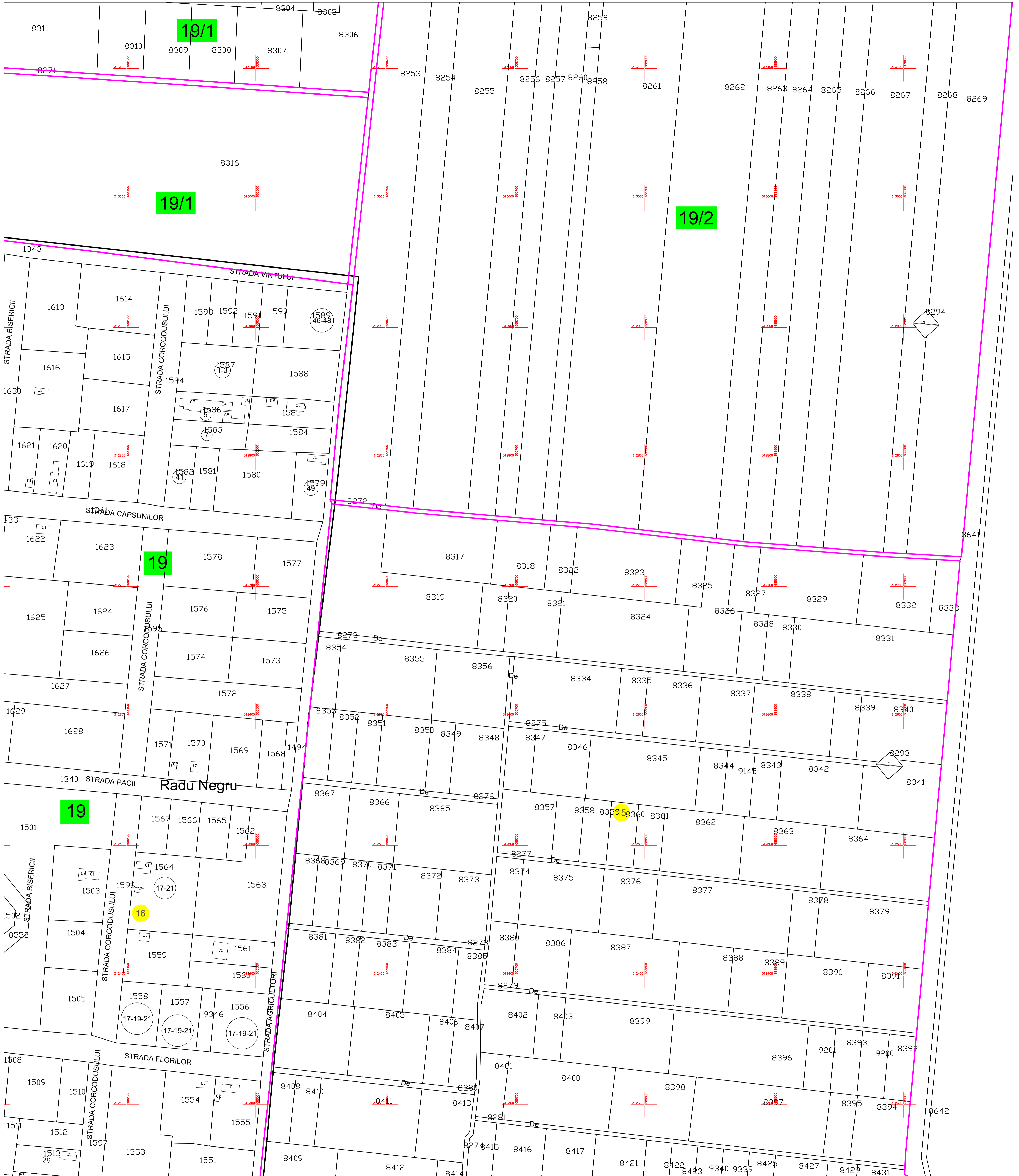
Schiță cu dispunerea sectoarelor cadastrale