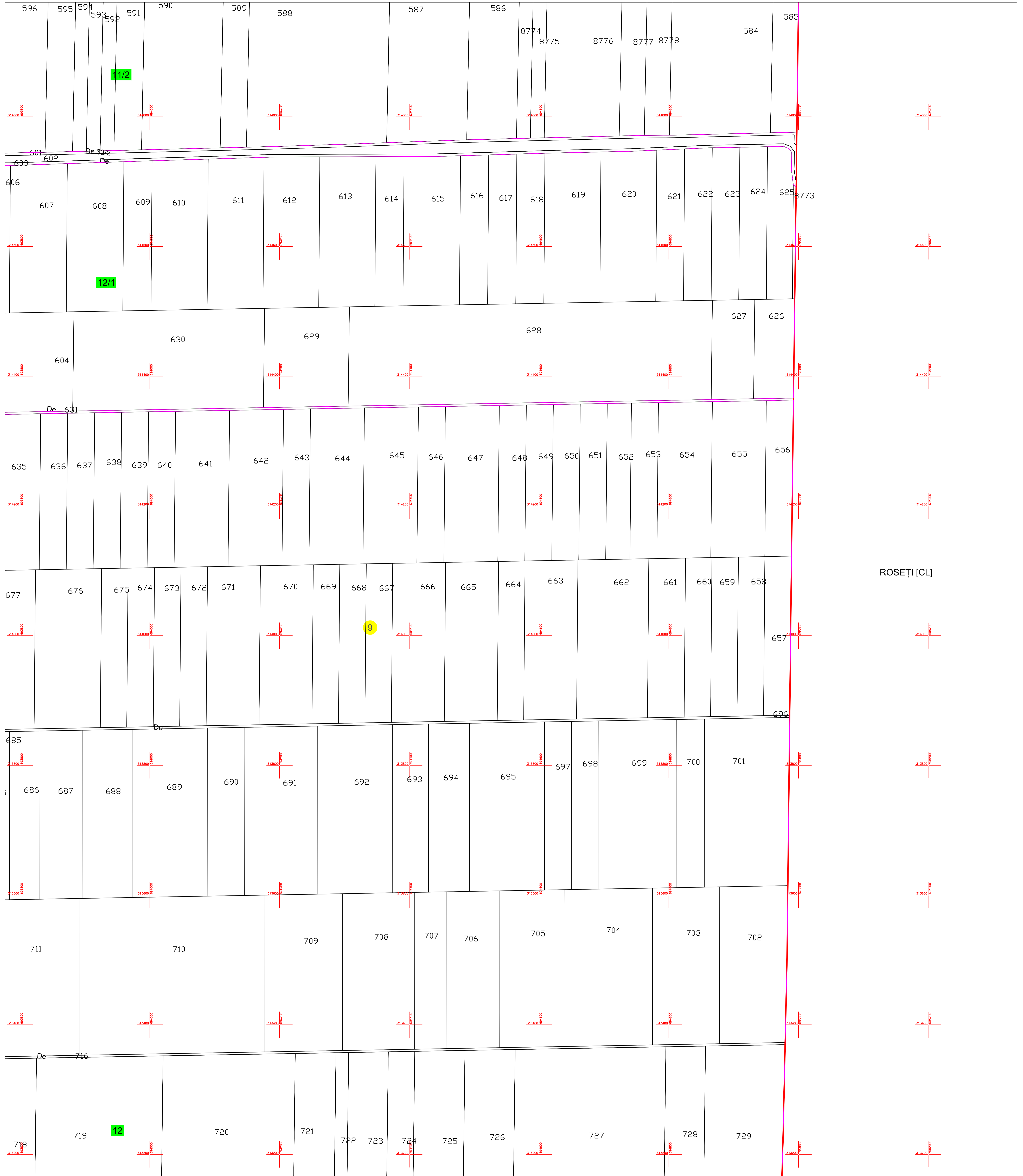
Schiță cu dispunerea sectoarelor cadastrale