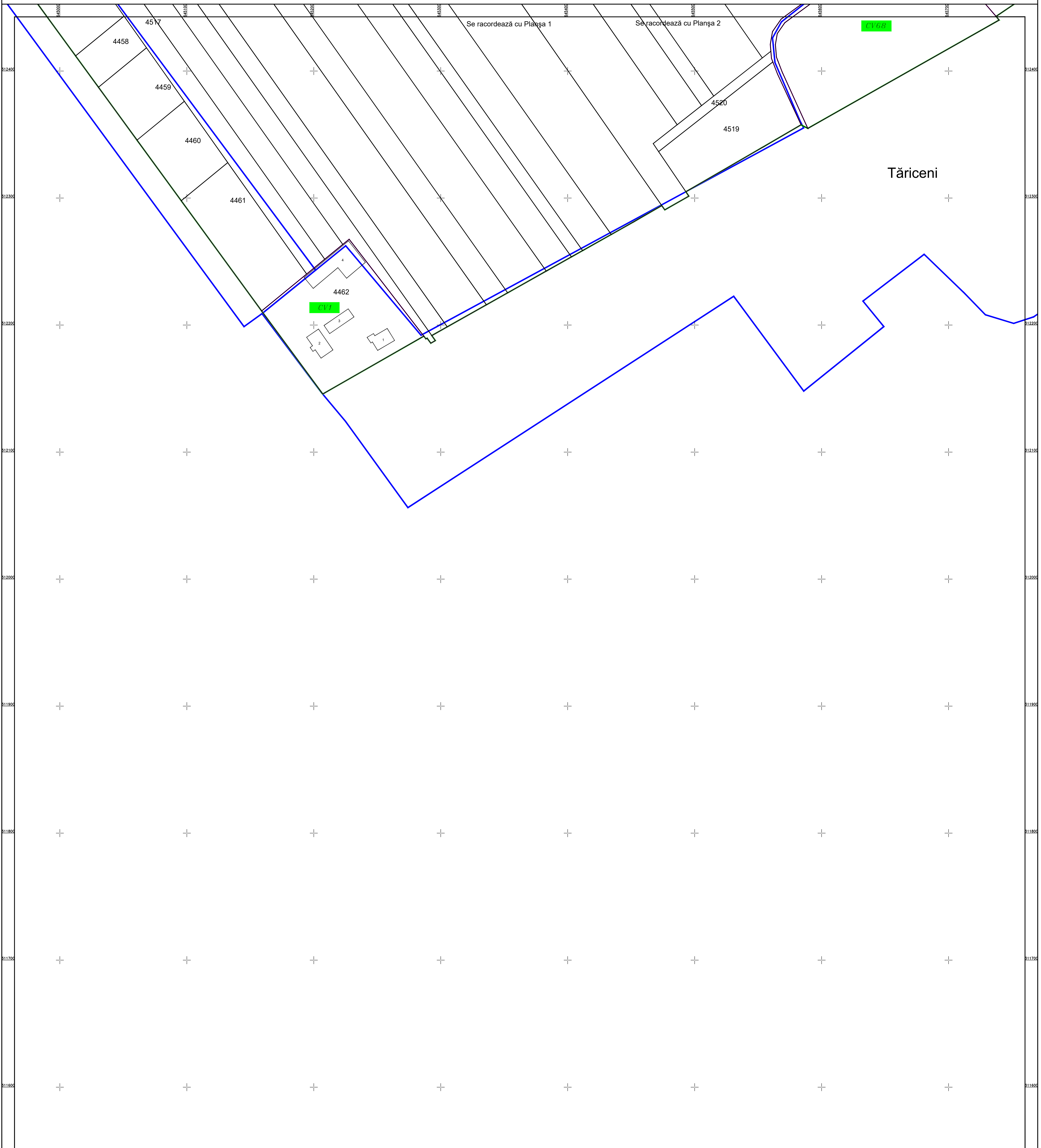
Schema de racordare a planșelor