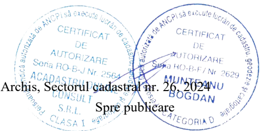
Pg. 2, înregistrare sistematica Archis, Sectorul cadastral nr. 26, 2024