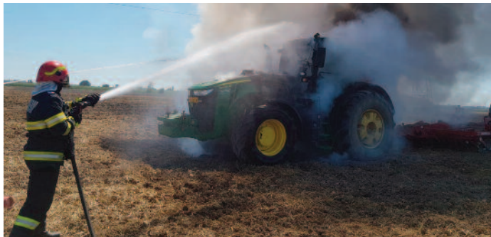
La stingerea incendiului au participat 10 pompieri

Luni, 14 august, în jurul orei 14.30, Inspectoratul pentru Situații de Urgență „Someș” al județului Satu Mare a fost alertat să intervină la stingerea unui incendiu produs la un tractor din localitatea Lazuri.