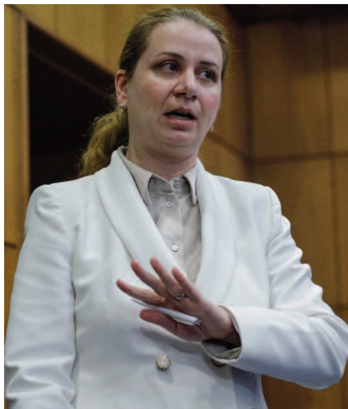
Ministrul Educației, Ligia Deca, anunță că în această sesiune de Bacalaureat „nu vom mai transporta lucrări dintr-un județ în altul pentru evaluare”

Calendarul Bacalaureatului de toamnă 2023: 16 august: Limba și literatura română – proba E.a) – proba scrisă; 17 august: Proba obligatorie a profilului – proba E.c) – proba scrisă; 18 august: Proba la alegere a profilului și specializării – proba E.d) – proba scrisă; 21 august: Limba și literatura maternă – proba E.b) – proba scrisă; 25 august: