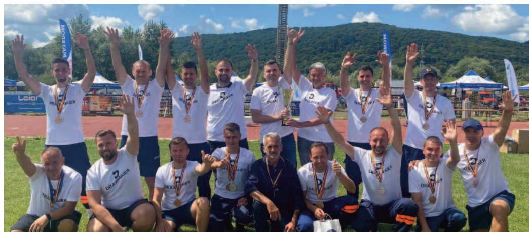
Echipa Draxlmaier Satu Mare a câștigat faza interjudețeană desfășurată în luna iulie

Săptămâna trecută, la Sighișoara s-a desfășurat faza națională a concursului dedicat pompierilor civili. După ce a devenit campionă județeană în luna mai, echipa Draxlmaier Satu Mare a câștigat faza interjudețeană desfășurată în luna iulie, și la care au participat 7 județene. Acum, sătmărenii au participat la mare finală.