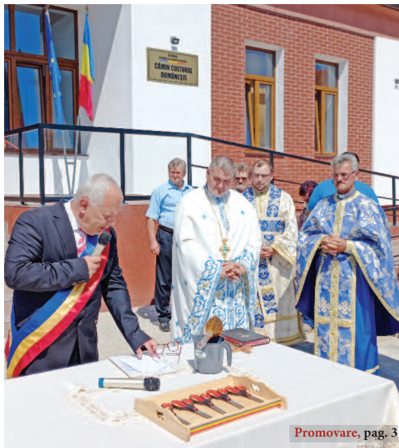
Inaugurarea căminului cultural din Domănești, investiție de 500.000 de euro