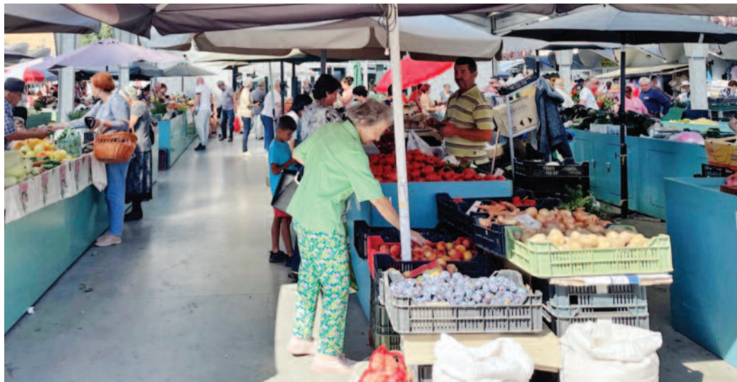
“Piața Mică” din Satu Mare, locul de întâlnire al sătmărenilor dornici de produse proaspete, sănătoase, din grădina omului care le și vinde

Ceapa de apă, denumită adesea și ceapa Caba, aduce o serie de beneficii pentru sănătate. Iată de ce ceapa de apă ar trebui să fie pe lista dumneavoastră de cumpărături: este o sursă bună de vitamine și minerale, inclusiv vitamina C, vitamina B6 și mangan; conține antioxidanți ce