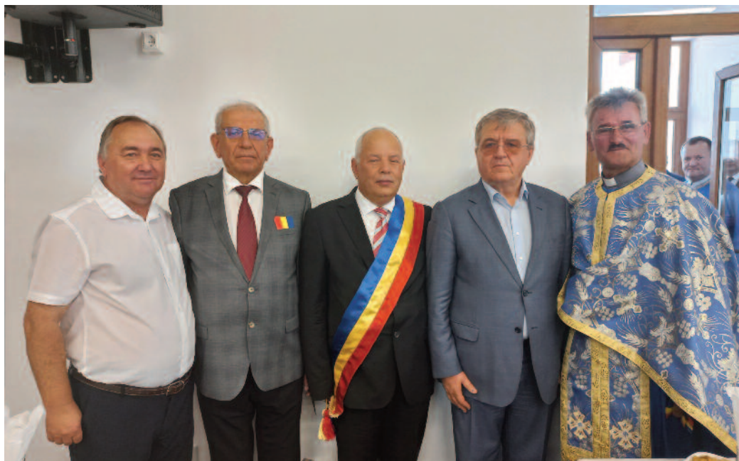
Duminică s-a inaugurat un obiectiv de suflet pentru locuitorii din Domănești, un simbol al satului

Cu maximă punctualitate, participării la slujbă, alături de soborul de preoți despre care făceam vorbire în cele de mai sus, au străbătut drumul de la biserică la Centrul cultural - Căminul cultural din sat, acolo unde, în jurul orei 13, a fost sfințit acest obiectiv deosebit de important pentru locuitorii satului. Așa cum am amintit,