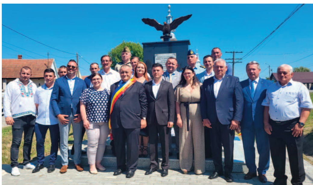
Vorbitorii prezenți la dezvelirea monumentului au reliefat importanța luptei pentru apărarea țării și a neamului românesc, o pagină de eroism fiind scrisă chiar la Doba în 19 aprilie 1919

Manifestarea cu o profundă încărcătură emoțională a început