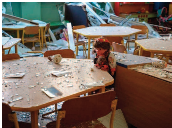
În timpul atacului rus asupra Liovului, una dintre rachete a lovit curtea grădiniței „Kazka”, creând un crater de 9 metri adâncime

Ministerul rus al Apărării a estimat marți că resursele armatei ucrainene sunt „aproape utilizate”, într-un moment în care Kievul desfășoară din luna iunie o contraofensivă pentru recucerirea teritoriilor ocupate de Moscova, relatează AFP, potrivit Agerpres. „Resursele militare ale Ucrainei sunt aproape epuizate”, a declarat Serghei Șoigu în cadrul unei conferințe privind securitatea de la Moscova, dând asigurări că Kievul „nu va obține rezultate”, în pofida „sustenirii totale” a Occidentului. El a afirmat că campania militară în Ucraina, lansată în urmă cu aproape un an și jumătate, s-a dovedit o „încercare serioasă” pentru armata rusă, dar că Rusia a reușit să crească „puternic” producția de vehicule blindate. În ceea ce privește armele occidentale livrate Kievului, Serghei Șoigu a afirmat că acestea nu au „nimic unic sau invulnerabil” pentru trupele ruse. „Suntem gata să împărțăm evaluările noastre privind punctele slabe ale echipamentelor occidentale”, a declarat ministrul rus, în fața unei adunări de responsabili militari internaționali. El le-a mulțumit de asemenea soldaților ruși care, potrivit lui, luptă în teren împotriva „neonazismului”, reluând discursul Kremlinului, care susține că ofensiva din Ucraina vizează înlăturarea unui regim neonazist. Cea de a 11-a ediție a Conferinței privind securitatea internațională de la Moscova, organizată de armata rusă și care se desfășoară marți în apropiere de capitală, reunește oficial peste