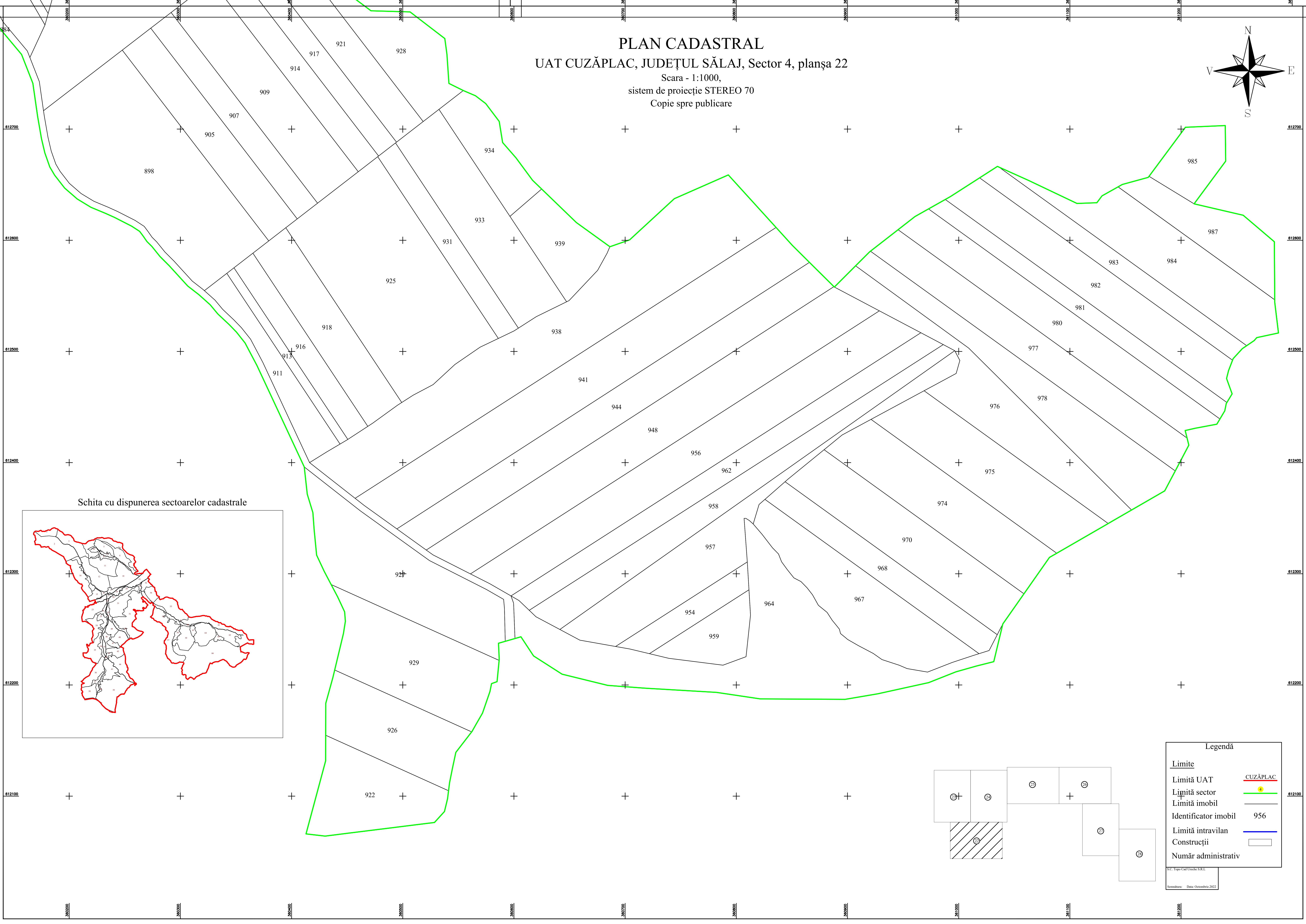
Schita cu dispunerea sectoarelor cadastrale