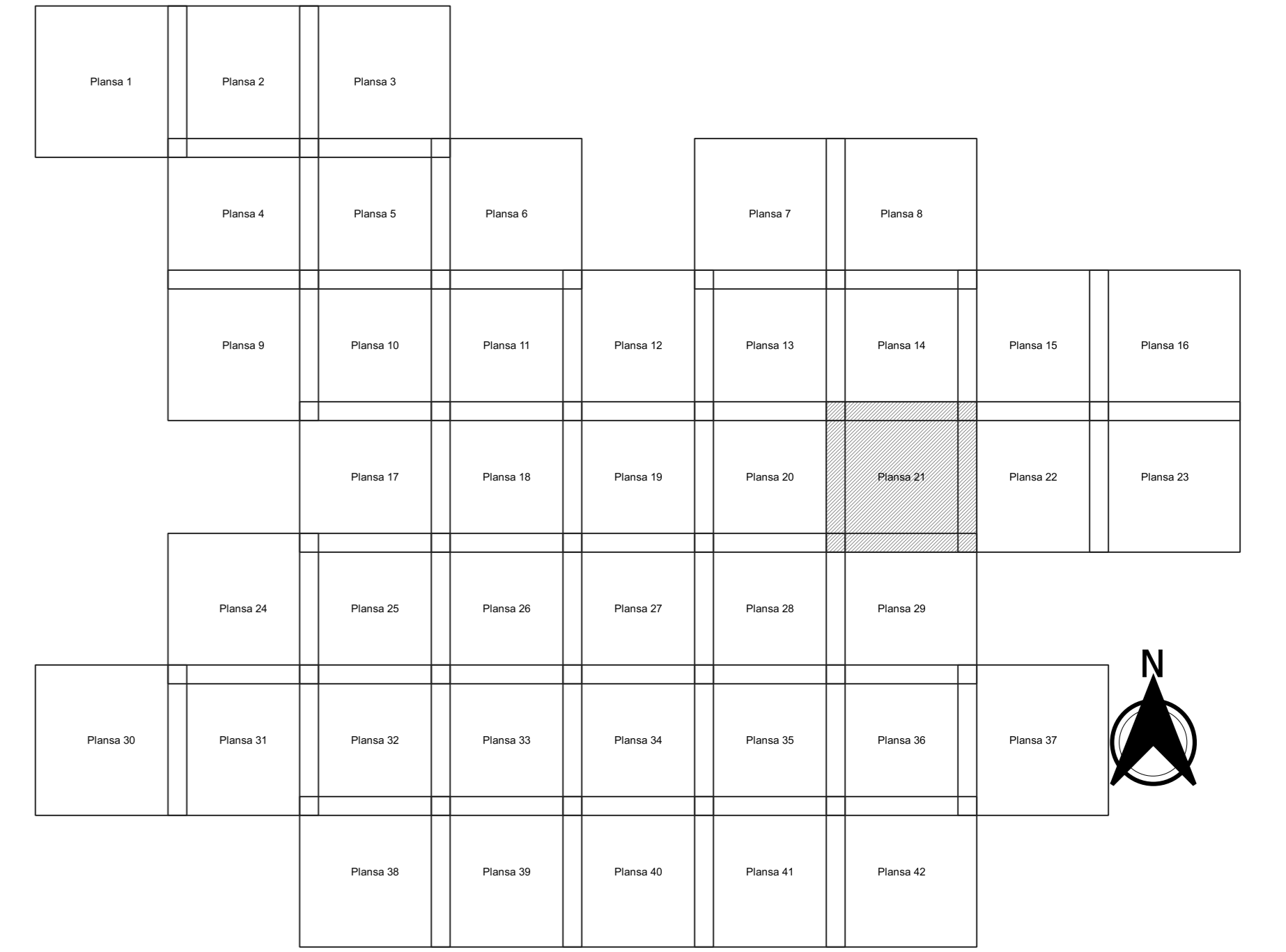
Schița de racordare a planșelor