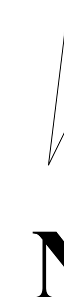
Schita cu dispunerea sectorului