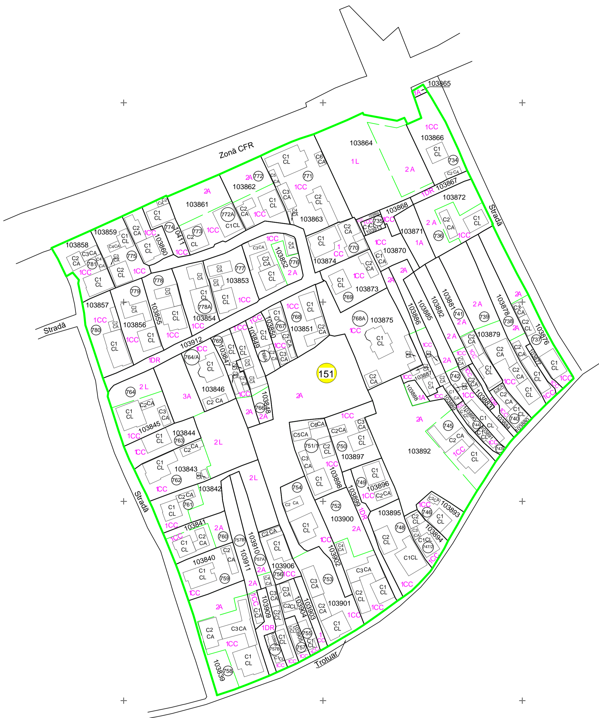
Schița de dispunere a sectoarelor